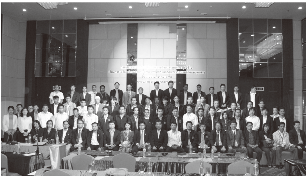
終了後、参加者全員で記念撮影

盤に「翌日1月22日から60日間、バンコク首都圏を中心に非常事態宣言が発令される」というニュースが入った以外は、和気藹々とした雰囲気でのレセプションであった。