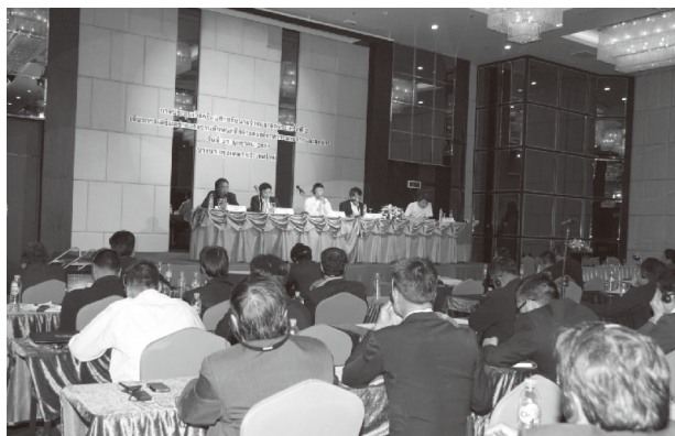
第2回タイ労使ワークショップを開催 (2014年1月21日、タイ)