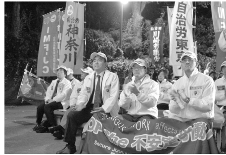
集会アピールを全員の拍手で採択