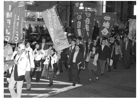
自動車総連メンバーと一緒に進行する JC 事務局