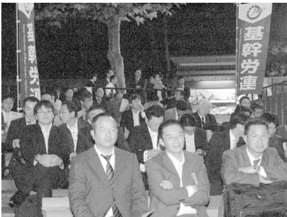
集会に参加する基幹労連の仲間たち