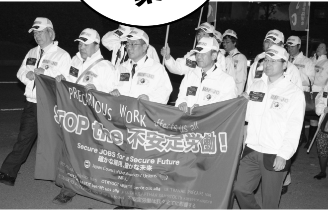
銀座通りを行進する IMF-JC議長・副議長