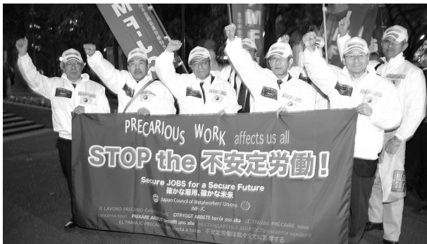
アピールウォークする IMF-JC 議長・副議長