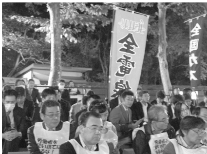
集会に参加する全電線の仲間たち