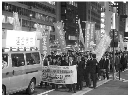
電機連合のメンバー