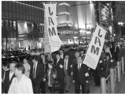
行進するJAMの仲間たち