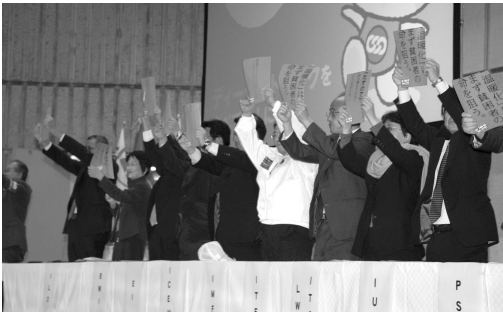
集会最後に行った「スタンドアップ」世界同時イベント