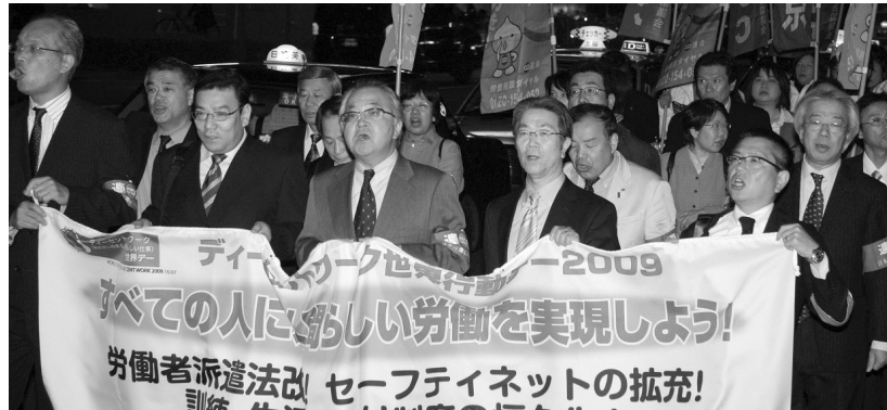
古賀連合会長を先頭に銀座を行進