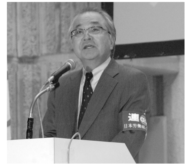
挨拶する古賀連合会長